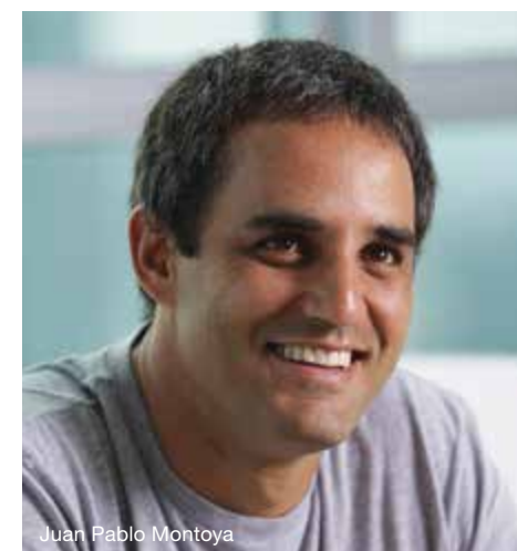
Juan Pablo Montoya

LA HISTORIA SE CUENTA A TRAVÉS DE LOS TESTIMONIOS DE FAMILIARES, AMIGOS Y GRANDES FIGURAS DEL AUTOMOVILISMO INTERNACIONAL COMO CHRISTIAN HORNER, MARK WEBBER, JUAN PABLO MONTOYA Y HELIO CASTRONEVES